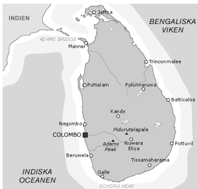
Karta Sri Lanka

År 1979 fick NIA uppdraget av regeringen att utöva tillsyn och kontroll över de auktoriserade adoptionsorganisationerna. Nu fick de ideella organisationerna en möjlighet att ansöka om auktorisation hos Socialstyrelsen för adoptionsverksamhet. I början av 1980-talet infördes ett obligatoriskt medgivande av socialnämnden i den kommun där de blivande adoptivföräldrarna bodde, för att en adoption skulle kunna genomföras. Detta medgivande utfärdades efter en prövning av de blivande adoptivföräldrarnas lämplighet. År 1981 blev NIA en självständig myndighet. Namnet ändrades till Statens Nämnd för Internationella Adoptionsfrågor. För närvarande finns sex auktoriserade adoptionsorganisationer i Sverige. Förbundet Adoptionscentrum (AC) är den största av organisationerna.